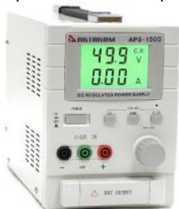
APS-1503, APS-1602, APS-1721, APS-1503L, APS-1602L, APS-1721L

Фотографии общего вида источников питания представлены на рис. 1. Схема пломбировки от несанкционированного доступа изображена на рис. 2.