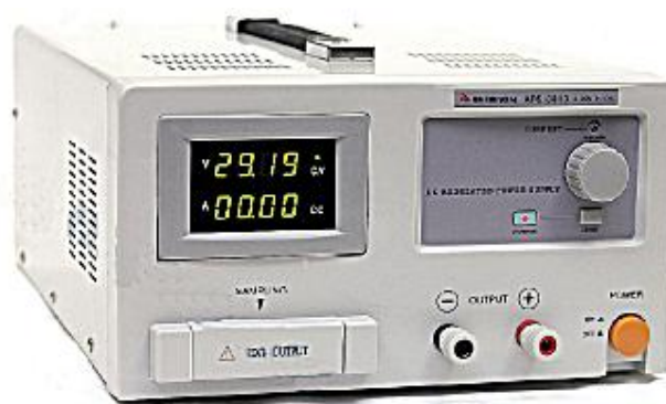
APS-3103, APS-3310, APS-3320, APS-3605, APS-3610, APS-3103L, APS-3310L, APS-3320L, APS-3605L, APS-3610L